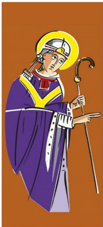
saint Hilaire Illustration de Jean-Pierre Maltier

Dieu notre Père, ton Fils Jésus a choisi lui-même les Apôtres pour sanctifier ton peuple, le conduire et lui annoncer l'Évangile.